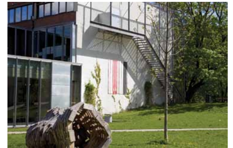
← Brynhild Slaatto Utendørs III (2009 mai-oktober) Ni vevde lengder i nylon, trossetau og møbelsnor 300 x 270 cm Produksjonsbistand på vev Ingri Ødegård